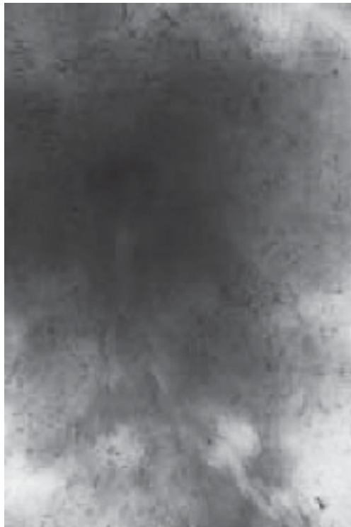
EVELYN FLORES Serie El fuego 2007