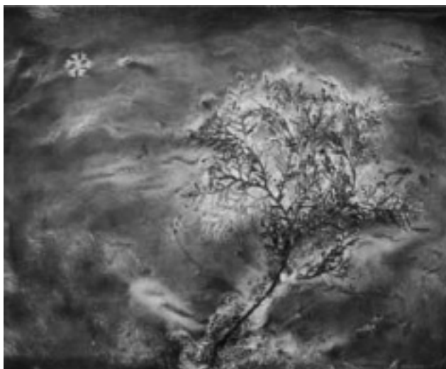
REINA MICHEL Sin título óleo, materia orgánica y acrilato sobre papel 32 x 49.5 cm 2005