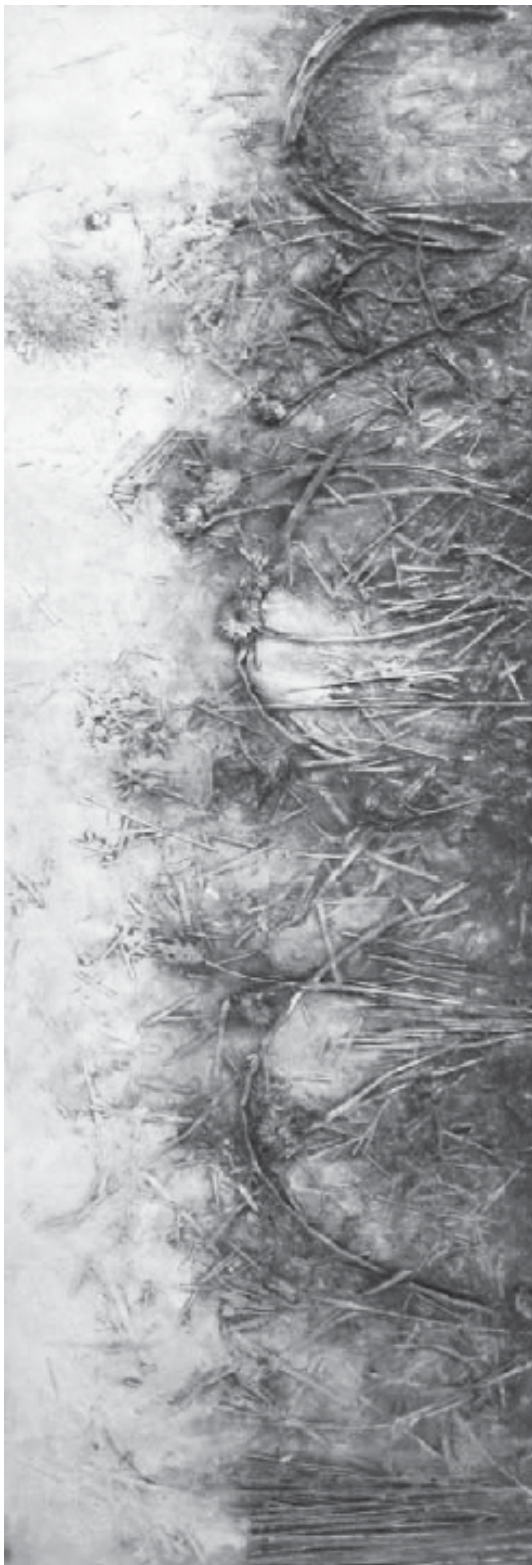
REINA MICHEL Sol hebreo encáustica, óleo y fibras naturales sobre madera 39 x 143.5 cm 2007