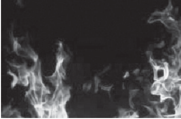
EVELYN FLORES Serie El fuego 2007