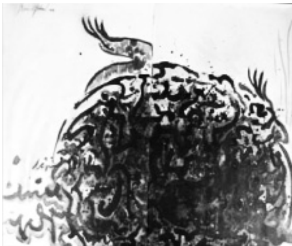
REINA MICHEL Tortuga (2 piezas) tinta, acrílico y acuarela sobre papel 69.9 x 102.7 cm 2006