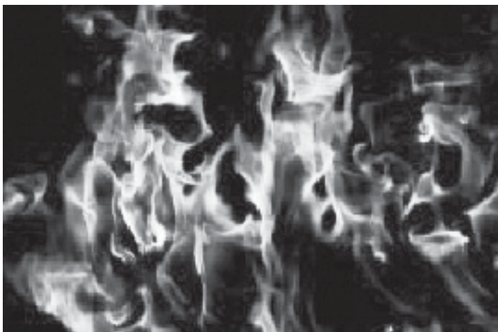
EVELYN FLORES Serie El fuego 2007