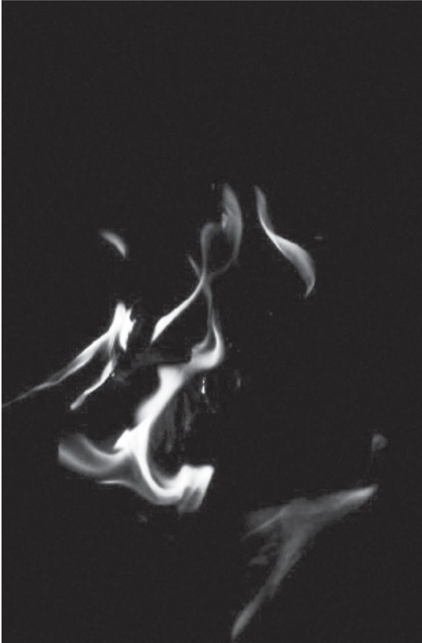
EVELYN FLORES Serie El fuego 2007