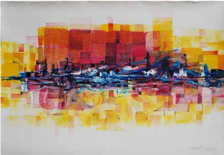
Título: Trayectos III