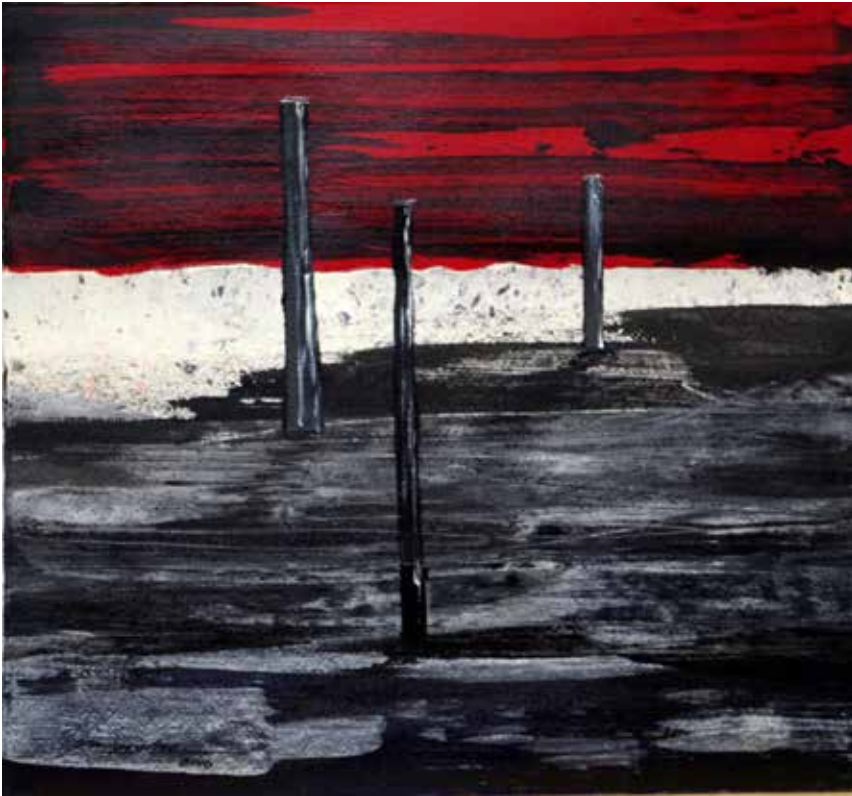
Título: Serie Trayectos V