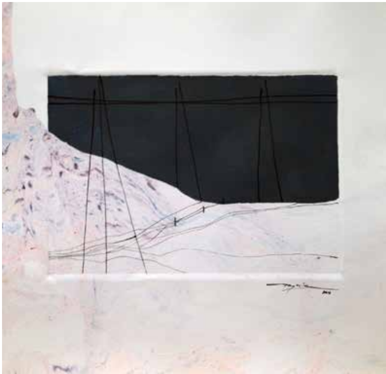
Título: Trayectos IV