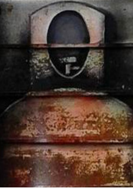
Título: Cilindros (fragmento) | Joel Alcázar