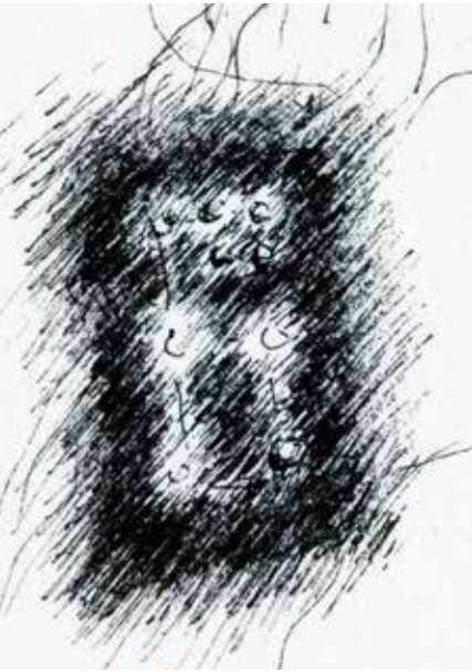
Título: Mano (fragmento), de Miguel Alejandro González Virgen