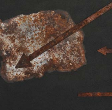
Obra: Negro. Tierras naturales y metal sobre madera.