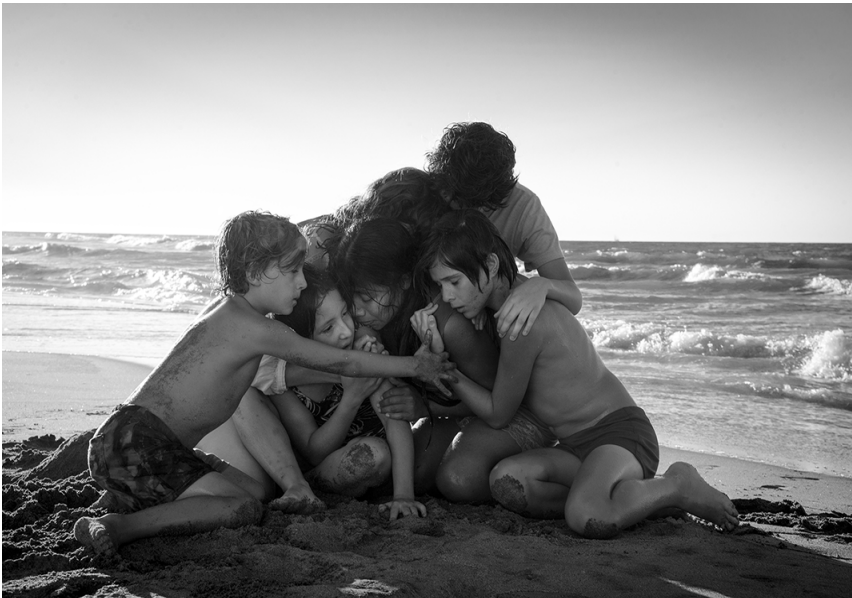
Foto de publicidad de la película. Cleo como la base de la pirámide familiar